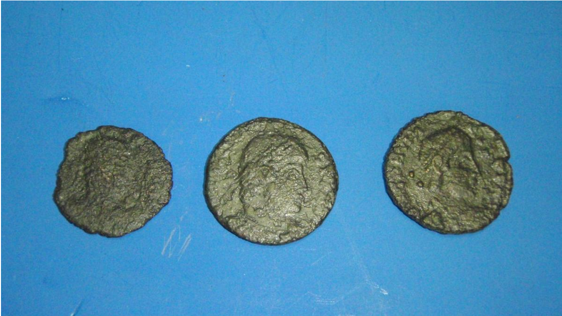
1 Hoofd onleesbaar, 2x Keizer ?? 353-455 n. C.