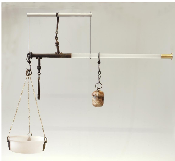
De unster.

Dit artikel in het Betuwe Boek, ook van de hand van Willem Spekking, is geschreven naar aanleiding van de vondst in dit gebied van een unster. Deze is nu te zien in museum Het Valkhof.