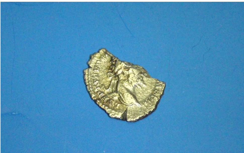
Denarius. Romeins. Keizer Septimius Severus, 193-211 n. C.