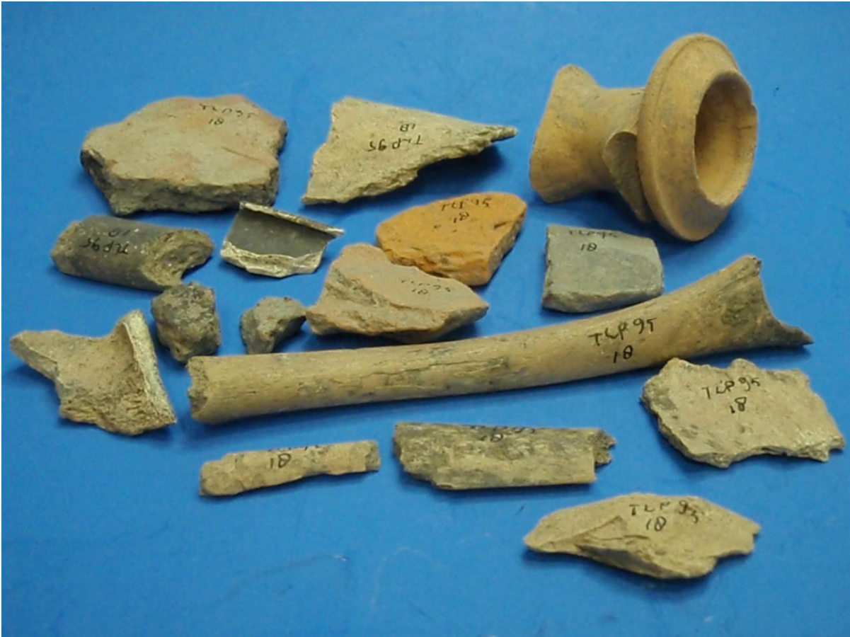
Aardewerk en botfragmenten uit stort leidingsleuf