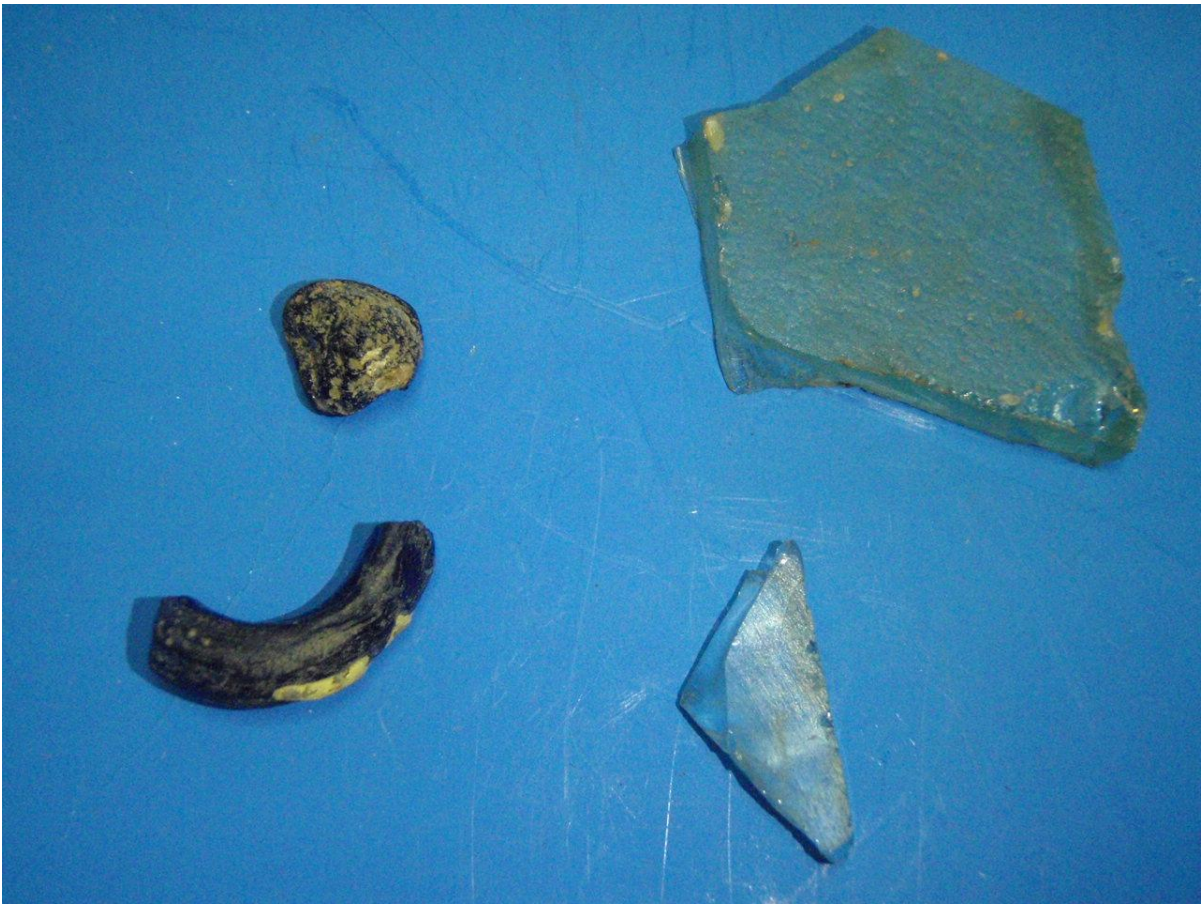
Fragmenten glas uit stort bouwput