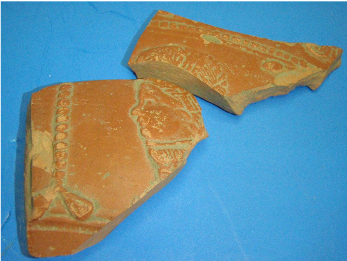
Terra Sigillata – afbeelding hoofd