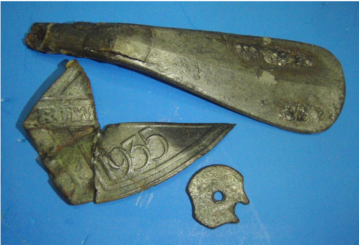
Lepelsteel, fietsplaatje (gerepareerd) uit 1935