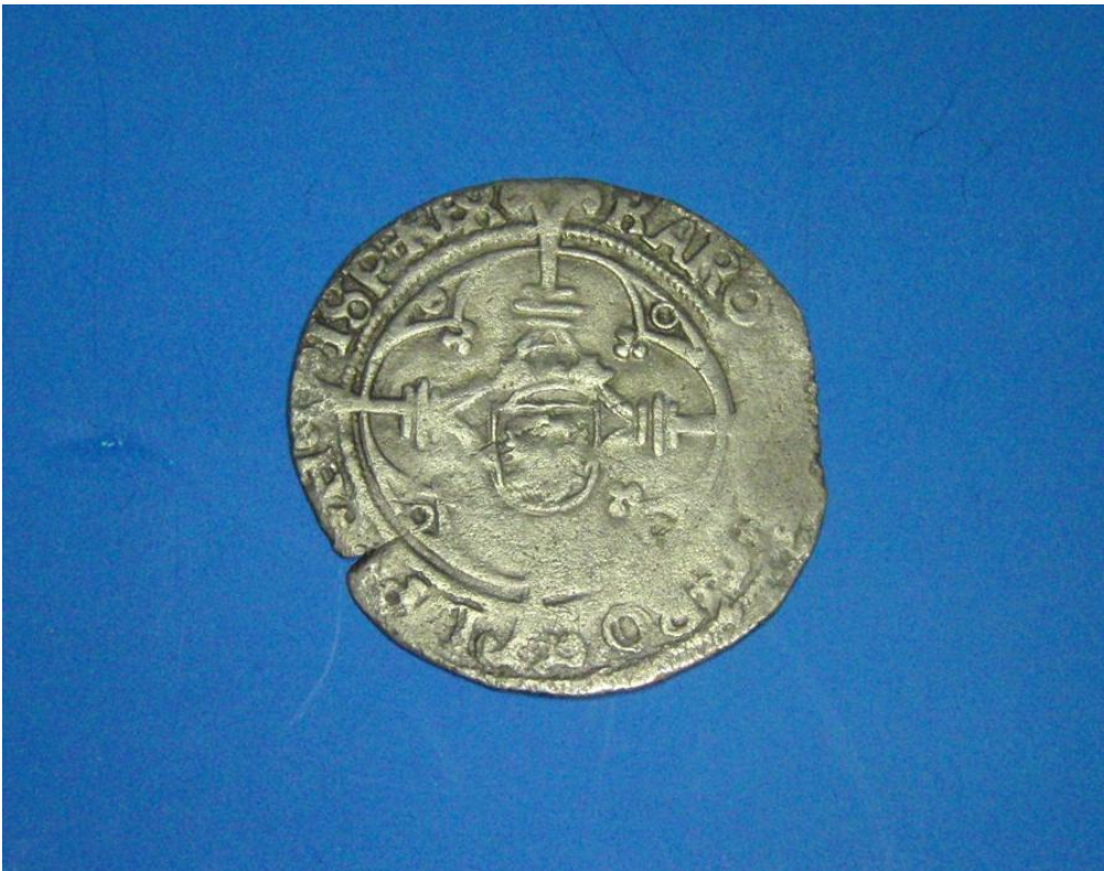
Karel V van Spanje (1506-1555). Wapenschild met 16 velden. Brabant. Stuiver / Patard ( 1 Sol) z.j , Karel V ( 1506-1555) , Brabant – Antwerpen